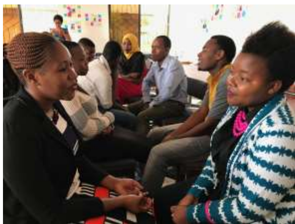
Werken in het carrousel

En de studenten hebben in hun familiegroepjes andere geslaagde ondernemers bezocht: een verkoper van kantoorbenodigdheden, een bedrijf voor voedselproductie: bananenwijn, -chips, een naaiatelier en een bedrijf voor metaalbewerking. Inspirerende voorbeelden: het naaiatelier heeft zich gespecialiseerd in feestjurken en ze merkten dat de klanten ook graag mooie schoenen aantrekken om de jurken te passen en nu verkopen ze ook feestschoenen.