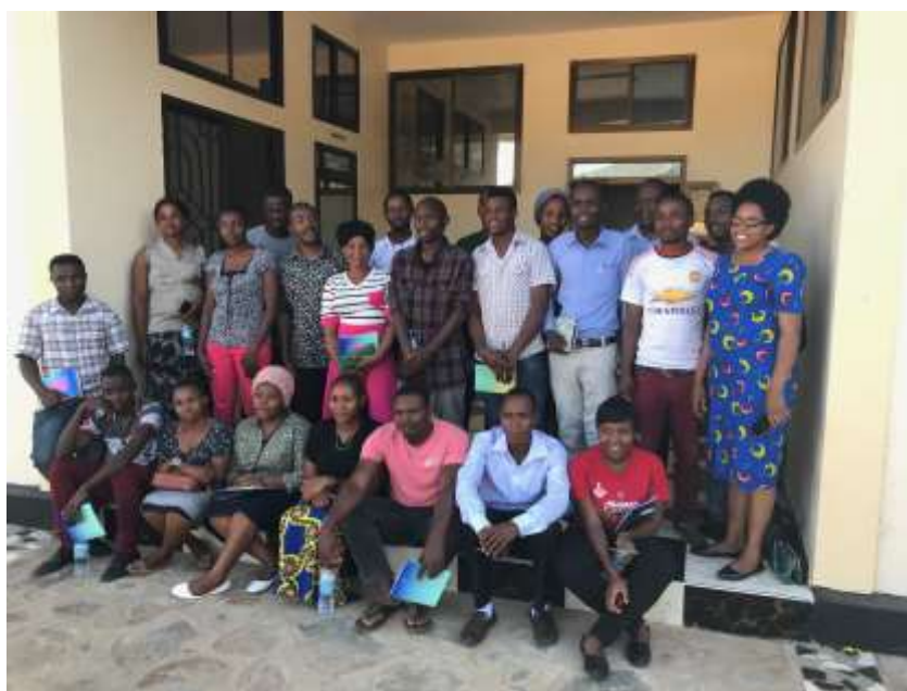
Groepsfoto eerste dag.