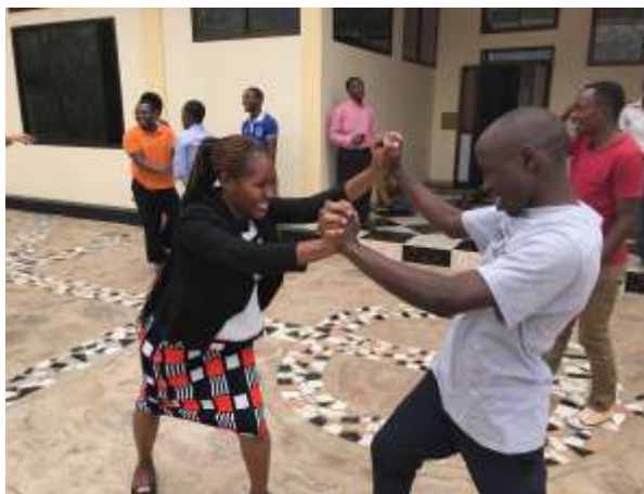
De kracht van een missie