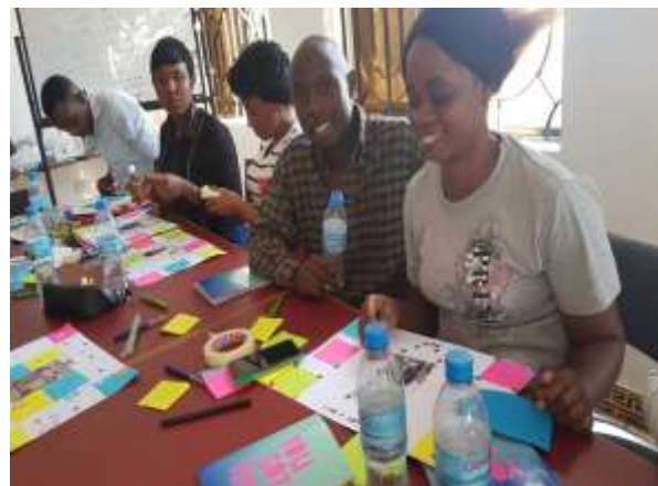
Aan de slag met het talentenboek

En de studenten hebben in hun familiegroepjes andere geslaagde ondernemers bezocht: een verkoper van kantoorbenodigdheden, een bedrijf voor voedselproductie: bananenwijn, -chips, een naaiatelier en een bedrijf voor metaalbewerking. Inspirerende voorbeelden: het naaiatelier heeft zich gespecialiseerd in feestjurken en ze merkten dat de klanten ook graag mooie schoenen aantrekken om de jurken te passen en nu verkopen ze ook feestschoenen.