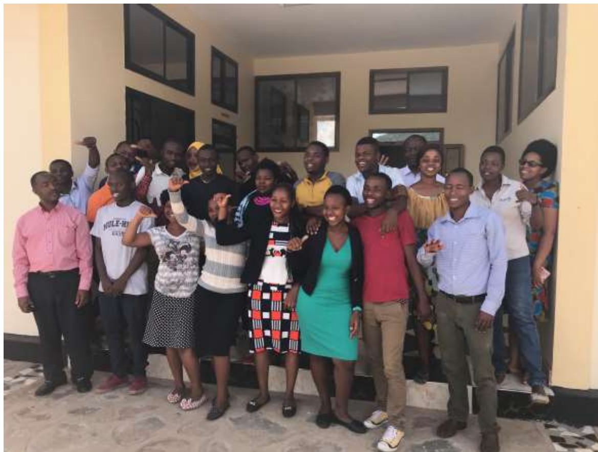
De hele groep na afloop