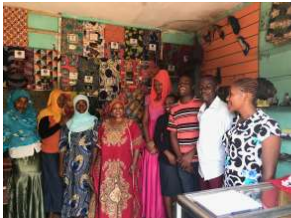
Bezoek aan naaiatelier

Hoe ga je je talenten inzetten als ondernemer? Met allerlei creatieve werkwijzen komen de talenten van de studenten boven water: in een rollenspel van verkopers op de markt ontdekken we veel meer talenten: communiceren, ontwerpen, inspelen op de wensen van klanten, improviseren, betrouwbaar zijn,.... En ze krijgen voorbeelden van geslaagde ondernemers: de vrouw die de catering verzorgt houdt een inspirerend verhaal: hoe ze 4 jaar geleden begonnen is en nu 15 vrouwen aan het werk heeft. Het geheim van haar succes: vooral hard werken! En doorzetten, je aan je afspraken houden, op tijd zijn, goed luisteren naar de vraag van je klant, lef hebben en op tijd meer mensen inschakelen.