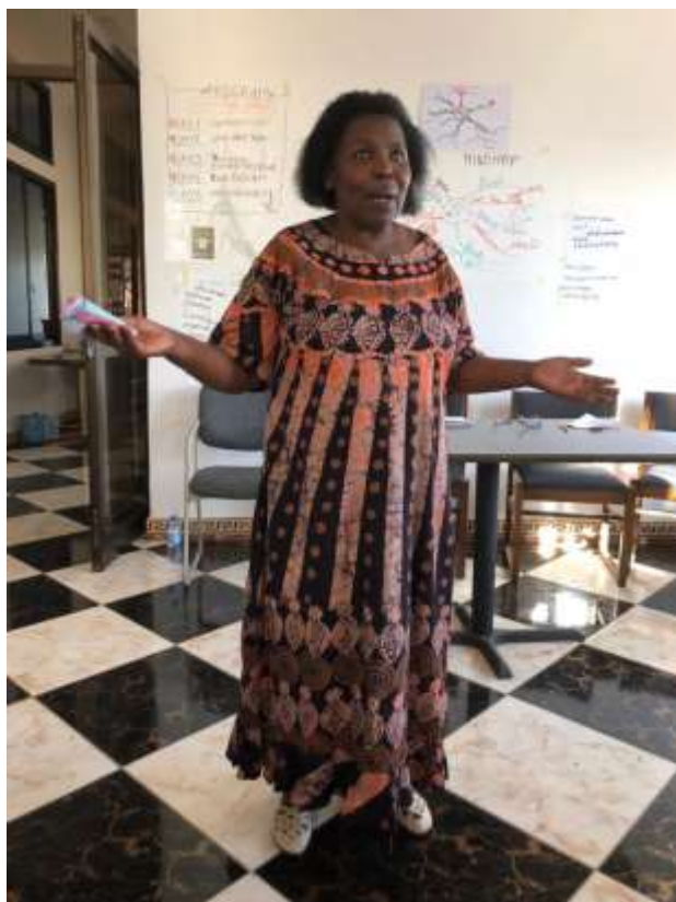
Toespraak van moeder van Mickness

Met ontroering zien we wat deze week de mensen heeft gebracht: zelfvertrouwen, durf om je droom te vertellen, concrete plannen voor de toekomst.