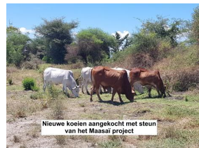
Nieuwe koeien aangekocht met steun van het Maasai project