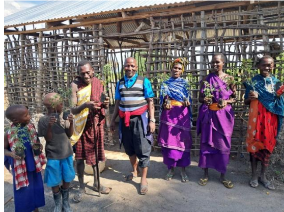
De grote boomkwekerij van de Tanzania National Forest Service en een aantal ontvangers van de jonge bomen.