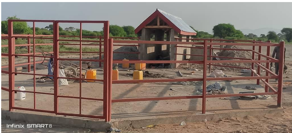
De cattle dip in aanbouw.

Bovendien is er een extra waterdrinkbak aangelegd en hebben drie Maasai jongeren een training gevolgd in veehouderij en landbouwmethoden. Een watertank met een capaciteit van 50.000 liter water is gebouwd bij Ruvu Mkanyeni B, die de hele boma van water voorziet. De tank krijgt het water middels een diesel pomp uit een bron die getest is op bacteriën en die geschikt is gebleken voor menselijke consumptie. De watertank zal in 2026 verbonden worden met de Mkanyeni dorpskliniek en met de in 2025 gebouwde cattle dip.