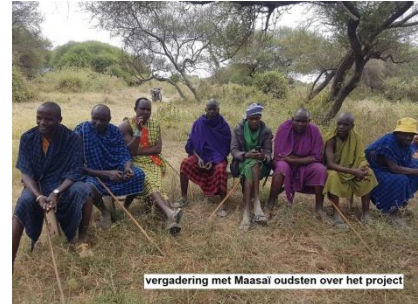
vergadering met Maasai oudsten over het project

In beide boma's is de watervoorziening drastisch verbeterd en zijn zonnepanelen geïnstalleerd en energiebesparende kookovens gebouwd. In 2024 is een omheining van prikkeldraad in Ruvu Makaneyni B gemaakt en hebben drie huishoudens ieder een Boran stier en koe ontvangen. De ervaringen met dit Boran vee zijn tot nu toe heel goed: de Boran koeien produceren 3 liter melk per dag, terwijl de lokale koeien slechts 0,3 liter melk per dag leveren. De betreffende huishoudens hadden zelf een waterbron gegraven ( een zgn shallow well) en een plot gereedgemaakt om het vee te huisvesten. Afgelopen jaar heeft de nadruk gelegen op het bewustmaken van de Maasai van het belang om tijdens de regenperiode gras te oogsten en te drogen en ook de restanten van de maïsoogst te bewaren als veevoer voor de droge periode.