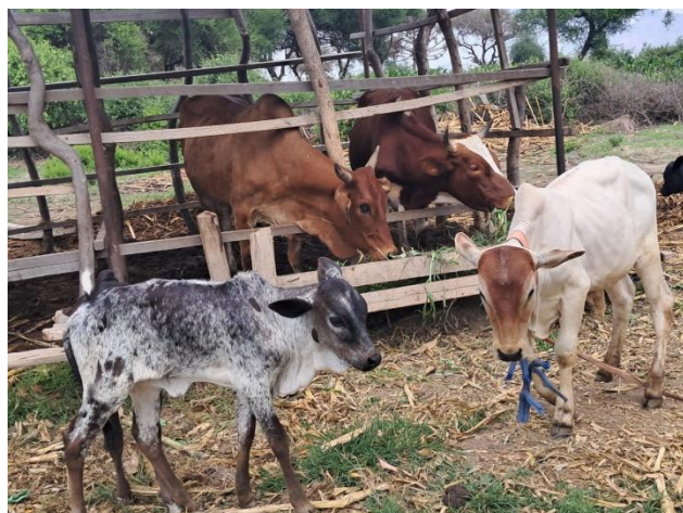
In juli 2025 is het eerste kalfje geboren uit een Boran stier en een lokale koe; inmiddels zijn er 5 kalfjes geboren.